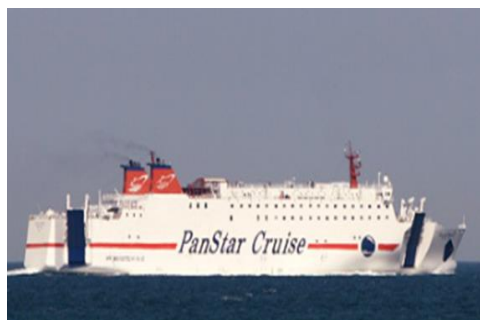
<パンスタードリーム号全景>