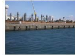
Public North Berth No.3-4