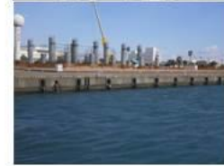
Public North Berth No.3-4