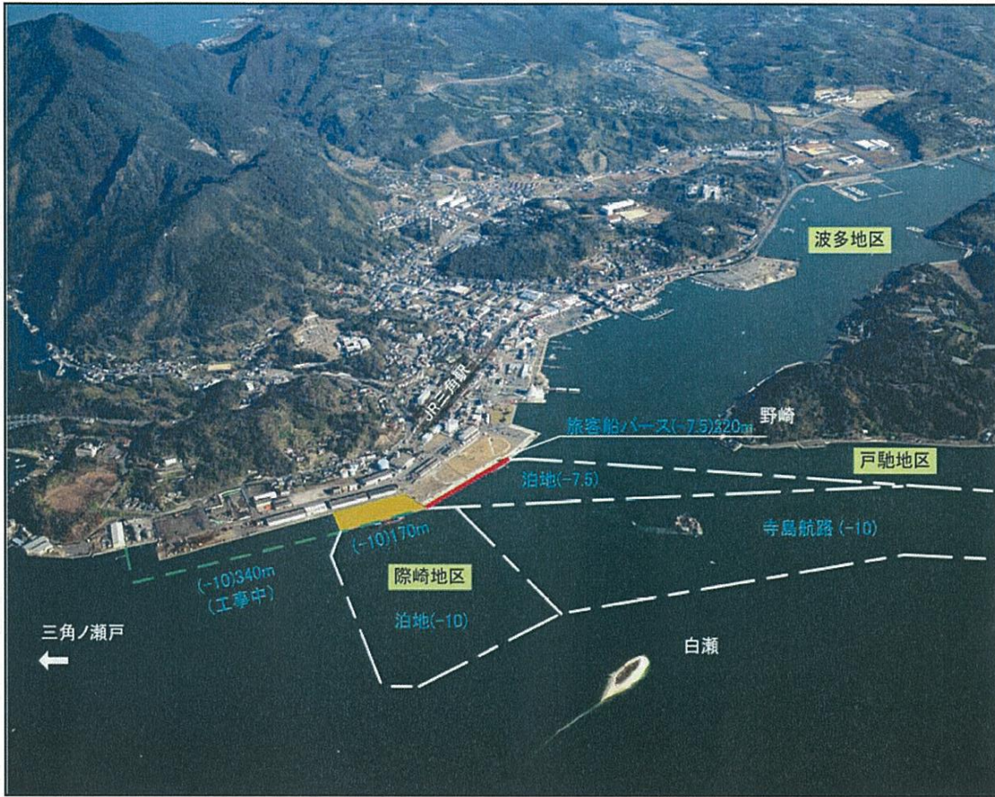
進入経路（寺島航路）と前面泊地