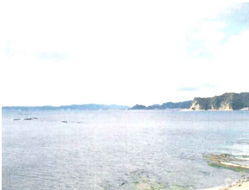
【現在の内浦湾(小湊湾)】

小湊実習場は、敷地の大半が岩や山林であり、施設の拡張や改善が望めないこと、台風や高潮の被害を受けやすいこと、さらに施設の老朽化により、館山市の坂田地区に移転が決まり、昭和 55 年（1980）9 月に移転が行われた。閉所後の小湊実習場は千葉大学に移管され、大学の付属となり千葉大学バイオシステム研究センターとして活用されている。