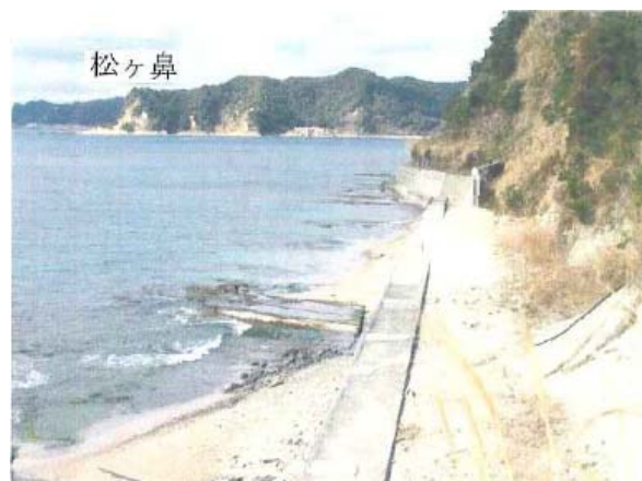
【内浦湾(小湊湾とも)】

小湊漁港に出入りする漁船は、明治末年1か年に地元船160隻、銚子・白浜・相模・伊