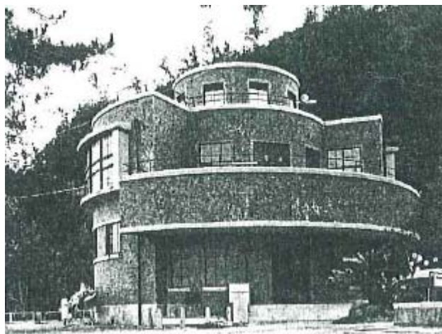
【珍しい円筒型の水族館】

本館の 1 階は水族館にあてられていたが、円型の建物は、誕生寺とならんで町のシンボリック的存在となり、子供たちの遠足に利用されるようになった。本館は太平洋に面していたため台風や高潮の被害をたびたび受けた。昭和 18 年（1943）10 月 3 日の激浪は海軍の築いた護岸壁も役に立たず、標本室が破壊され多数の図書や標本を流失した。また、昭和 33 年（1958）9 月 18 日の台風 21 号