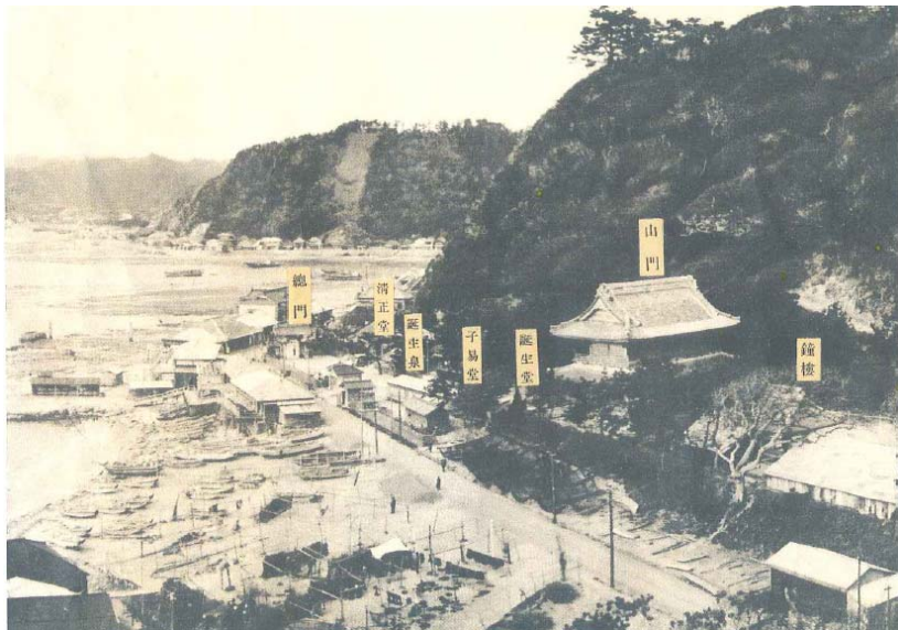
【昭和初年ころの誕生寺門前と小湊漁港】

漁業組合も町の補助を受けながら諸事業を施設し、面目を一新した。すなわち、昭和15年には共同販売所、漁船への給水設備、共同倉庫、アワビ・伊勢エビの養殖場、共同加工場、製氷工場、重油タンク、漁船機関修理工場などの各種漁業施設が短期間のうちに整い、飛躍的に水産物の増産を実現した。水揚げ金額は、昭和12年に24万円余りであったが昭和15年には3倍の67万円余りに達した。水揚げ金額を漁獲物別に見ると、鯖が28万円あまりで4割を占め、次いで金目鯛が10万円余り、イカが5万円余りであった。小湊町産物の昭和15年の販売額は、前掲のように水産物が圧倒的に多く、それに次ぐのは木炭の4万7,000円余りであった。