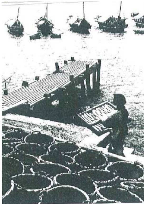
【昭和 6 年ころの小湊漁港】

享保 19 年（1734）6 月の「網方宗門人別証文」によれば、紀州の有田郡須原村・海士郡