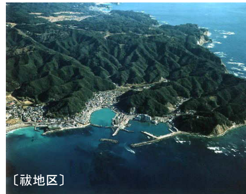
【現況写真】